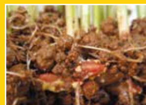
タフブロックの菌が発達、成熟すると赤い色素を出す特性があります。