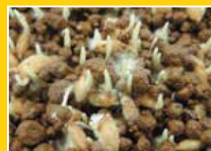
出芽処理後、表面に露出した種もみなどにタフブロックの白い菌糸がもみの周りに見える場合があります。