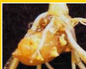
もみ殻表面での タフブロックのコロニー