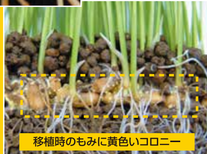
移植時のもみに黄色いコロニー