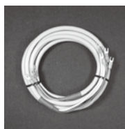
③暖房機と制御盤 接続用ケーブル